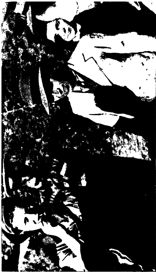
पं० जवाहरलाल नेहरू : स्पेन में इन्टरनेशनल ब्रिगेड के साथ